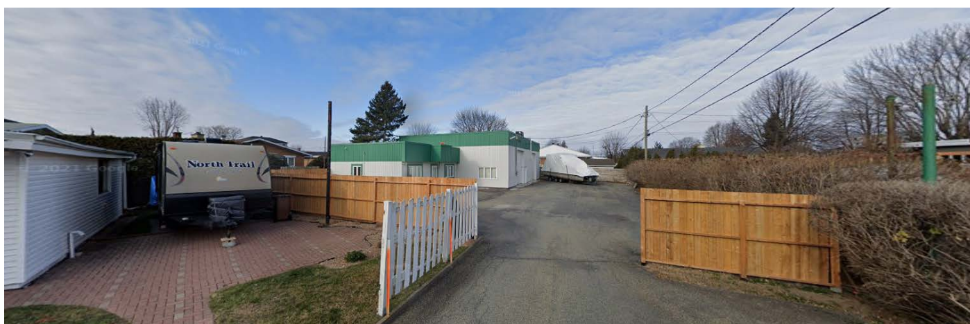
Vues aérienne et panoramique – Site à l'étude 680, rue Plante