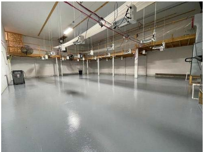
Photos – bâtiment existant 680, rue Plante