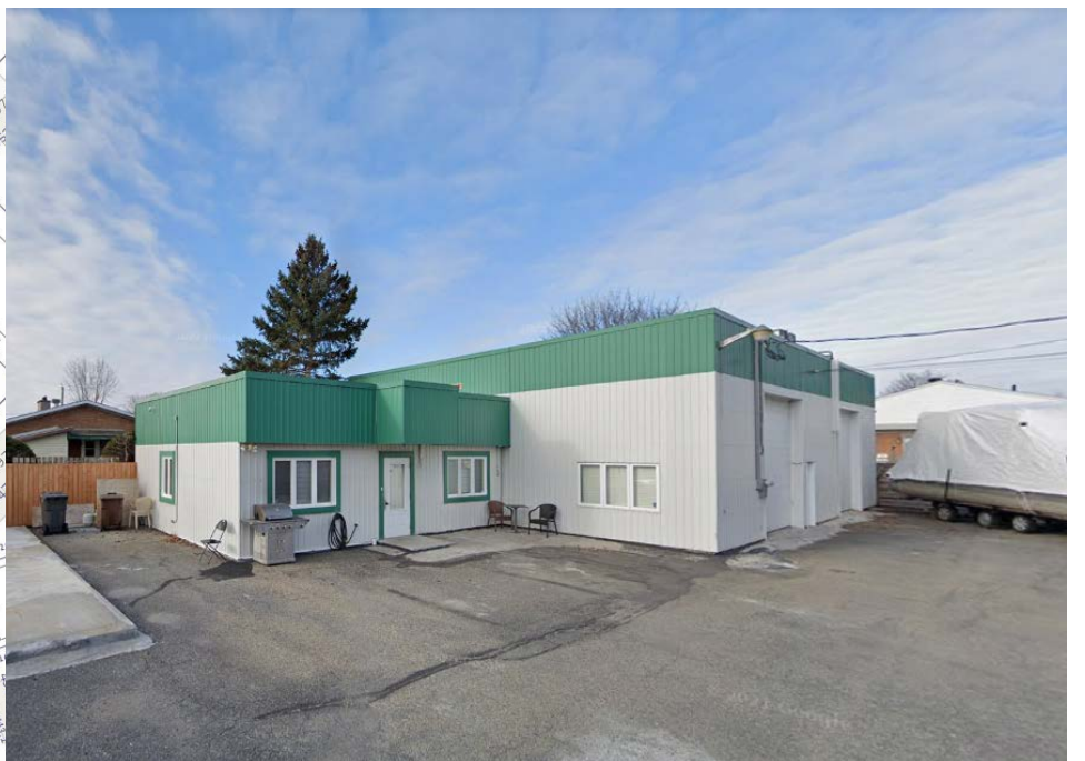
Localisation – Site à l'étude 680, rue Plante